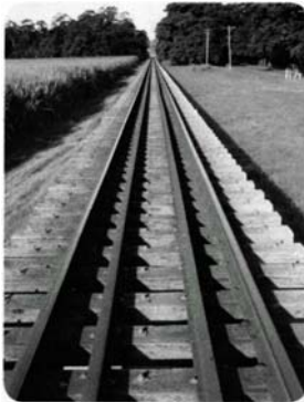
CROSSTIES could have a major warming impact depending on the material used.

A single railroad crosstie may not impact the environment as much as it helps to keep rails together. But considering that millions are deteriorating around the world, the material chosen as a replacement can affect the amount of carbon dioxide (CO 2 ) in the air. Wood crossties require harvesting a lot of CO 2 -absorbing trees, roughly 89,000 cubic meters of timber per million crossties; concrete versions increase greenhouse gas emissions because of the fuel consumption during their manufacture. Robert H. Crawford of the University of Melbourne in Australia concludes that making enough concrete ties to keep one kilometer of tracks aligned for 100 years generates the equivalent of 656 to 1,312 metric tons of CO 2 . That amount is about one-half to one-sixth the amount that timber ties contribute, because concrete versions last longer and timber releases CO 2 as it decays.